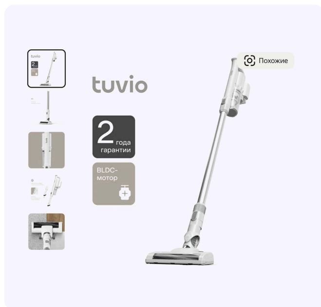
Rasm va ma'lumotlar yetarli bo'lmagan misol