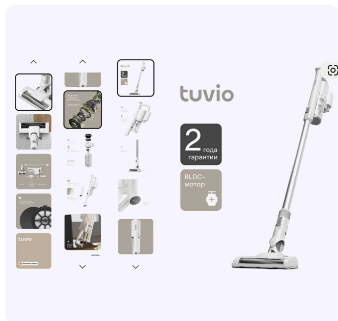
Rasmlar soni va sifati yetarli bo'lgan misol